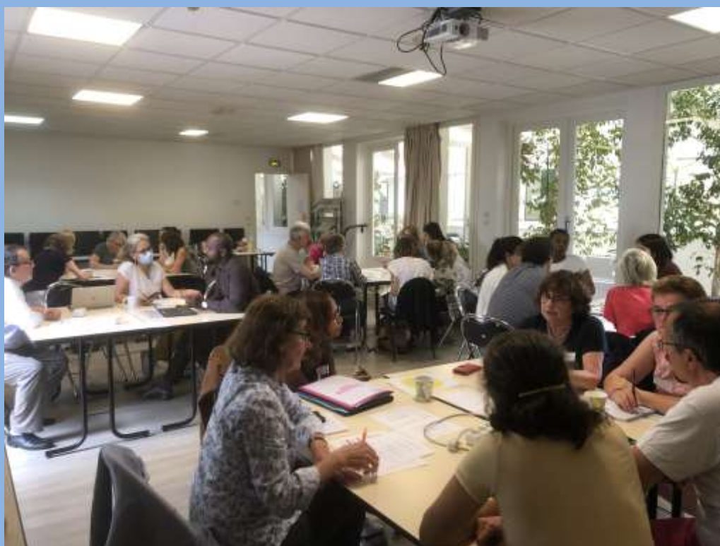
Rencontre des acteurs engagés contre la précarité financière - 21 juin 2022

CENTRE COMMUNAL D'ACTION SOCIALE Centre Alexandre Portier 21 bis, rue des Bordeaux 94220 CHARENTON-LE-PONT