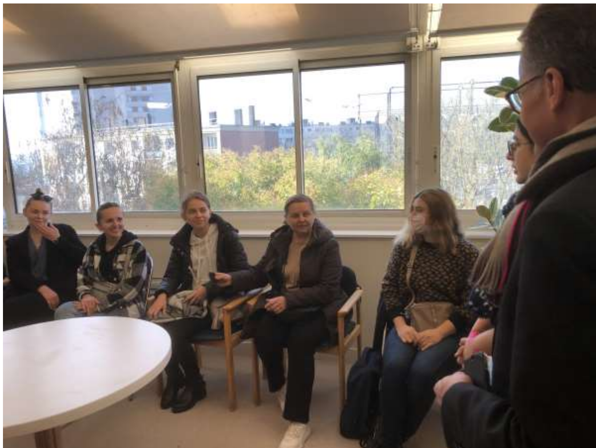
Accueil des réfugiées ukrainiennes en mars 2022